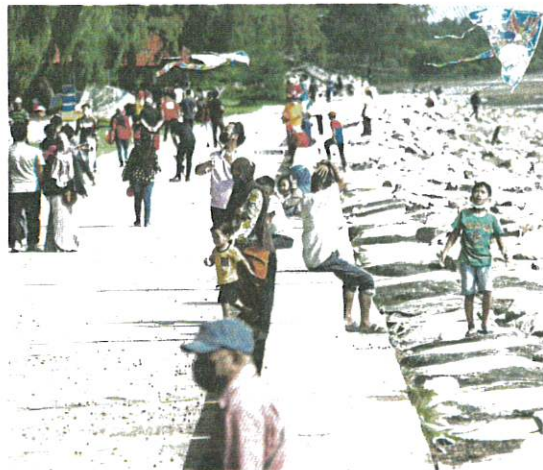
People enjoying outings at the beach in Morib, Selangor, on Sunday. Malaysia recorded a decline in new Covid-19 cases up to noon yesterday with 16,073 infections.

Ventilator usage was the highest in Pahang with 37 cases (55.9