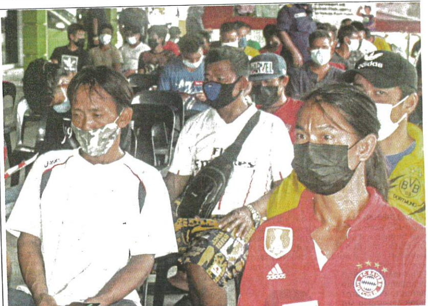
Fishermen waiting to get vaccinated in Pasir Puteh, Kelantan, on Sept 10.

"The National Recovery Plan depends on the strategic approach of vaccination to avoid future lockdowns and closing of economic sectors."