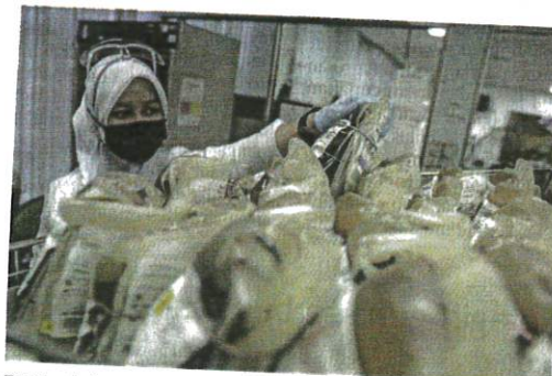
Trend peningkatan pendermaan darah akan memastikan PDN dan tabung-tabung darah mempunyai stok simpanan darah yang mencukupi bagi kegunaan pesakit.

Mengulas lanjut, Noryati berkata, terdapat juga pesakit Covid-19 terutamanya mereka yang mempunyai latar bela-