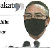
Hishammuddin Hussein, Menteri Kanan Pertahanan

ber ini untuk melihat pandemik dalam konteks endemik, bagaimana kita boleh cari jalan untuk hidup bersama COVID-19 dengan rasionalnya mesti dibincangkan dari sekarang," katanya.