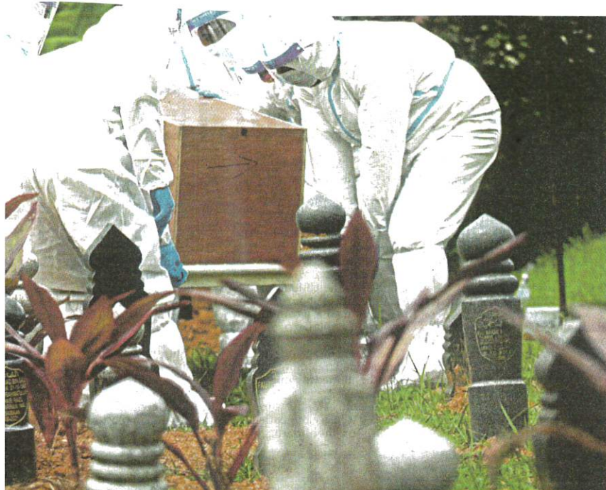
Seberang Prai Utara district Health personnel burying a Covid-19 victim in Tasek Gelugor, Penang, on Sunday.

per cent utilised), followed by 45 cases in Penang (52.2 per cent utilised) and 41 cases in Kedah (51.6 per cent utilised).