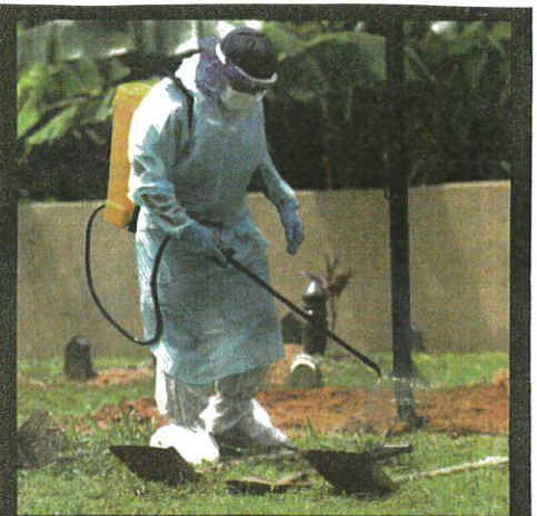
KAKITANGAN Pejabat Kesihatan Daerah Seberang Perai Utara menyahkumkan peralatan selepas menguruskan jenazah Covid-19.

Oleh Noor Atiqah Sulaiman am@hmetro.com.my