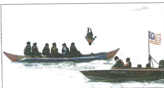
SEORANG pengunjung melakukan aksi balik kuang dari banana bot di Pantai peranginan Teluk Kemang, Port Dickson semalam.

mencatatkan penurunan kepada 99 kes semalam.