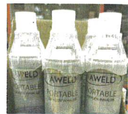
Kerajaan perlu menetapkan satu garis panduan mengenai penjualan dan penggunaan penyedut oksigen mudah alih yang berada di pasaran.

"Sekarang ini banyak orang suka membeli melalui dalam