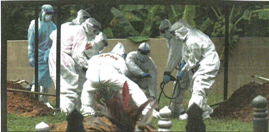
KAKITANGAN Pejabat Kesihatan Daerah Seberang Perai Utara dibantu anggota Angkatan Pertahanan Awam Malaysia (APM) menguruskan jenazah Covid-19 di Tanah Perkuburan Islam Lahar Yood, Tasek Gelugor, Kelantan.