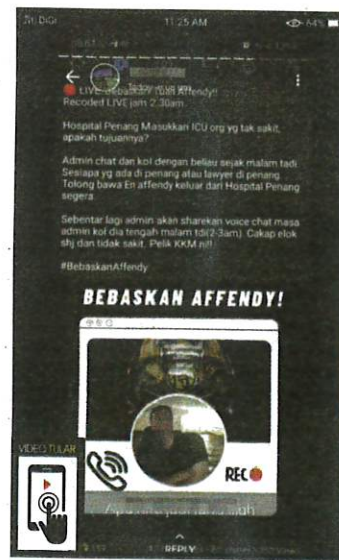
Rakaman perbualan telefon pesakit yang tular di laman sosial.

MEDEPANI KRISIS COVID-19: APA TINDAKAN KITA?